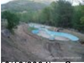
(16/10/2004) -- Separación de piscinas y conducciones de agua en las piscinas.