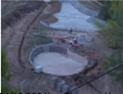
(24/10/2004) -- Cimentación de las piscinas.